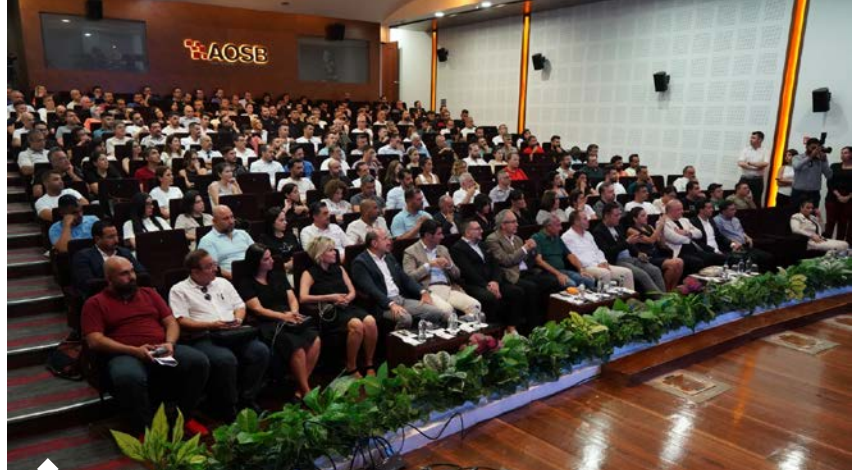
2Blackdot Danışmanlık'ın Adana Hacı Sabancı OSB ev sahipliğinde gerçekleştirdiği Afrika'ya İhracat Fırsatları etkinliğine iş dünyası yoğun ilgi gösterdi.

Başta Avrupa olmak üzere birçok bölgede nüfusun Afrika kadar artmayacağını belirten Bengisu, özetle şunları söyledi: "2050 yılında 2,5 milyarlık nüfusa