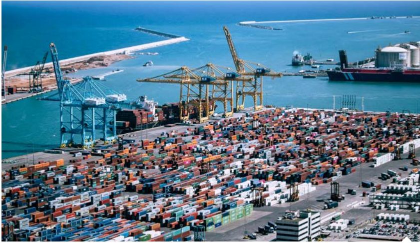
AKİB, 2024 yılı Ocak-Temmuz ayları arasında yüzde 19 artışla 9,89 milyar dolar ihracat değerine erişti.