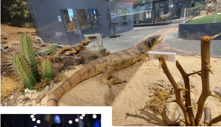
Çukurova Biyoçeşitlilik Tanıtım Merkezi, Seyhan Baraj Gölü kıyısındaki Çobandede mevkisinde bulunuyor.