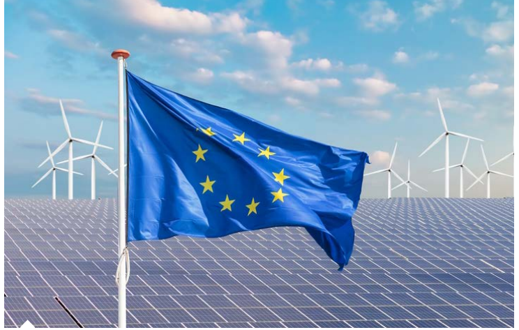
Avrupa Birliği, SKDM ile çimento sektöründe karbon salımını azaltmayı teşvik ediyor, üretim süreçlerini çevre dostu ve enerji verimli hâle getirmeyi hedefliyor.