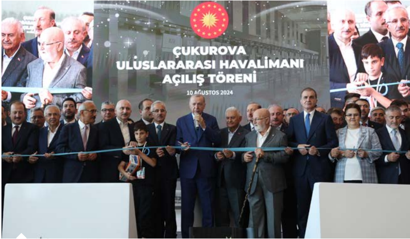
Havalimanının açılış kurdelesini Cumhurbaşkanı Erdoğan ve protokoldekiler tarafından kesildi.

Cumhurbaşkanı Erdoğan, son yıllarda ülkeye kazandırdıkları pek çok eseri kamu-özel ortaklığıyla hayata geçirdiklerini anımsatarak şöyle devam etti: